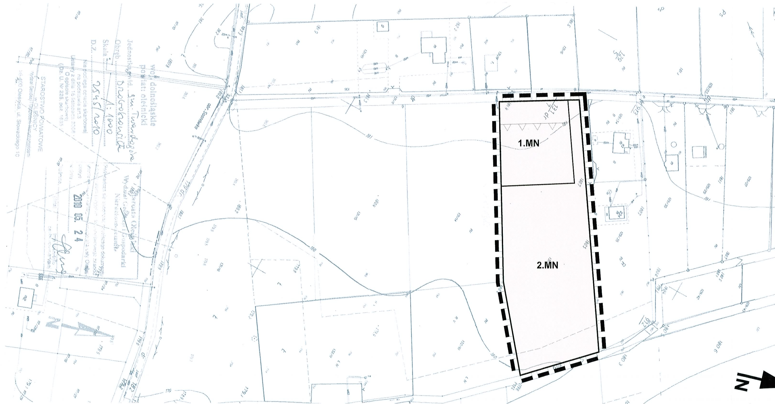
20 40 60 80 100 rysunek w skali 1:1000

dla terenu działki nr 131/13, AM1, położonej w obrębie Drogosz