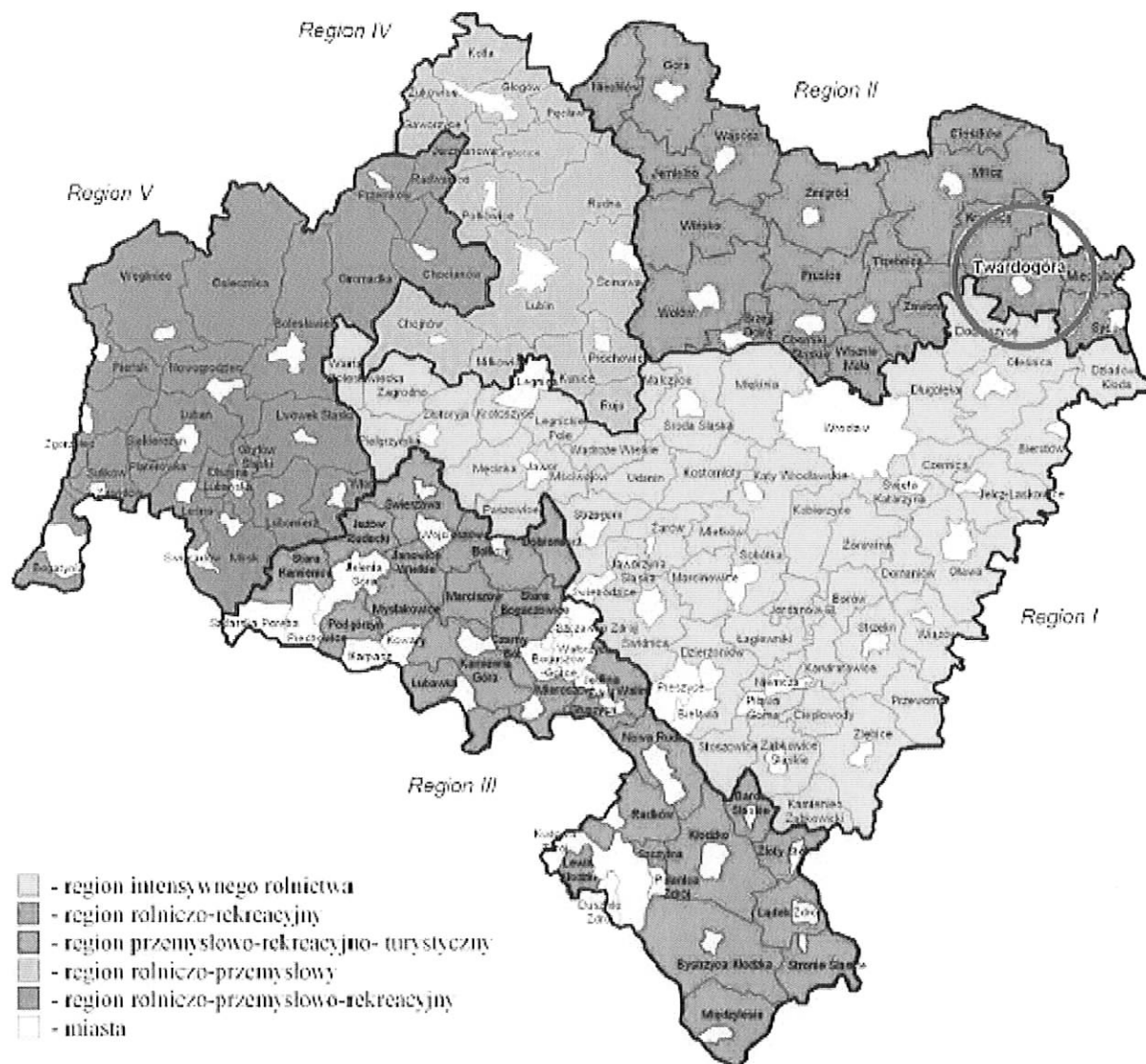
Rys. nr 1. Regiony funkcjonalne Dolnego Śląska.